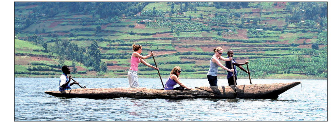
TØMMERSTOKK: En dag padlet elevene fra Strand i en uthulet tømmerstokk. Innsjøen Lake Bunyonyi er eneste vann i Uganda som er fritt for tropeparasitten Bilharzia, også uten krokodiller og flodhest!

– Vi har det så utrolig godt hjemme i Norge. Der nede kaver de for alt vi tar for en selvfølge. Heretter skal maten spises opp og ikke hives, lover hun.