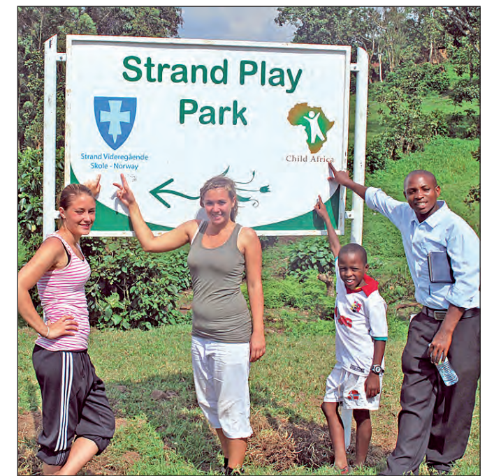
LEKEPARK: Skiltet til Strand Play Park har kommet på plass. Penger fra SVS sin innsamling i fjor skal gå til lekeapparater og baner for fotball, tennis, netball.

Samtidig knyttet jentene sterke bånd til elevene på skolen.